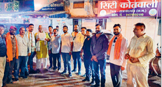
हरिभूमि न्यूज़ ►► राजनांदगांव

ब्राह्मण समाज को लेकर फिल्म निर्माता निर्देशक अनुराग कश्यप द्वारा की गई टिप्पणी पर ब्राह्मण समाज में आक्रोश देखा जा रहा है। आज ब्राह्मण समाज के युवाओं ने शहर के कोतवाली थाना में पहुंचकर फिल्म निर्माता निर्देशक अनुराग कश्यप के खिलाफ एफआईआर दर्ज करने आवेदन दिया है। सर्व ब्राह्मण समाज द्वारा अपने शिकायत आवेदन में कहा गया है कि प्रसिद्ध फिल्म निर्देशक अनुराग कश्यप द्वारा हाल ही में दिए गए एक बयान में ब्राह्मण समुदाय के प्रति अत्यंत आपत्तिजनक, अमर्यादित और घृणास्पद भाषा का प्रयोग किया गया है। उनकी यह टिप्पणी ने केवल सामाजिक सौहार्द को बिगाड़ने वाली है, बल्कि यह एक सम्पूर्ण समुदाय की मान-मर्यादा और भावनाओं को ठेस पहुंचाने वाली है। भारत जैसे विविधताओं वाले देश में ऐसी गैर-जिम्मेदारी और जातिगत वैमनस्यता फैलाने वाली टिप्पणियां अत्यंत निंदनीय है। एक सार्वजनिक हस्ती होने के